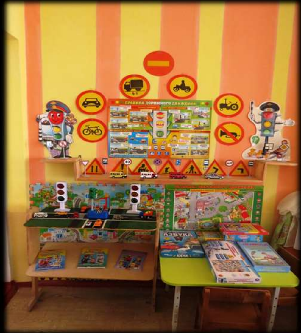
Модуль ПДД - Знаки, плакаты, макеты, пособия, настольные игры, модели специальной техники