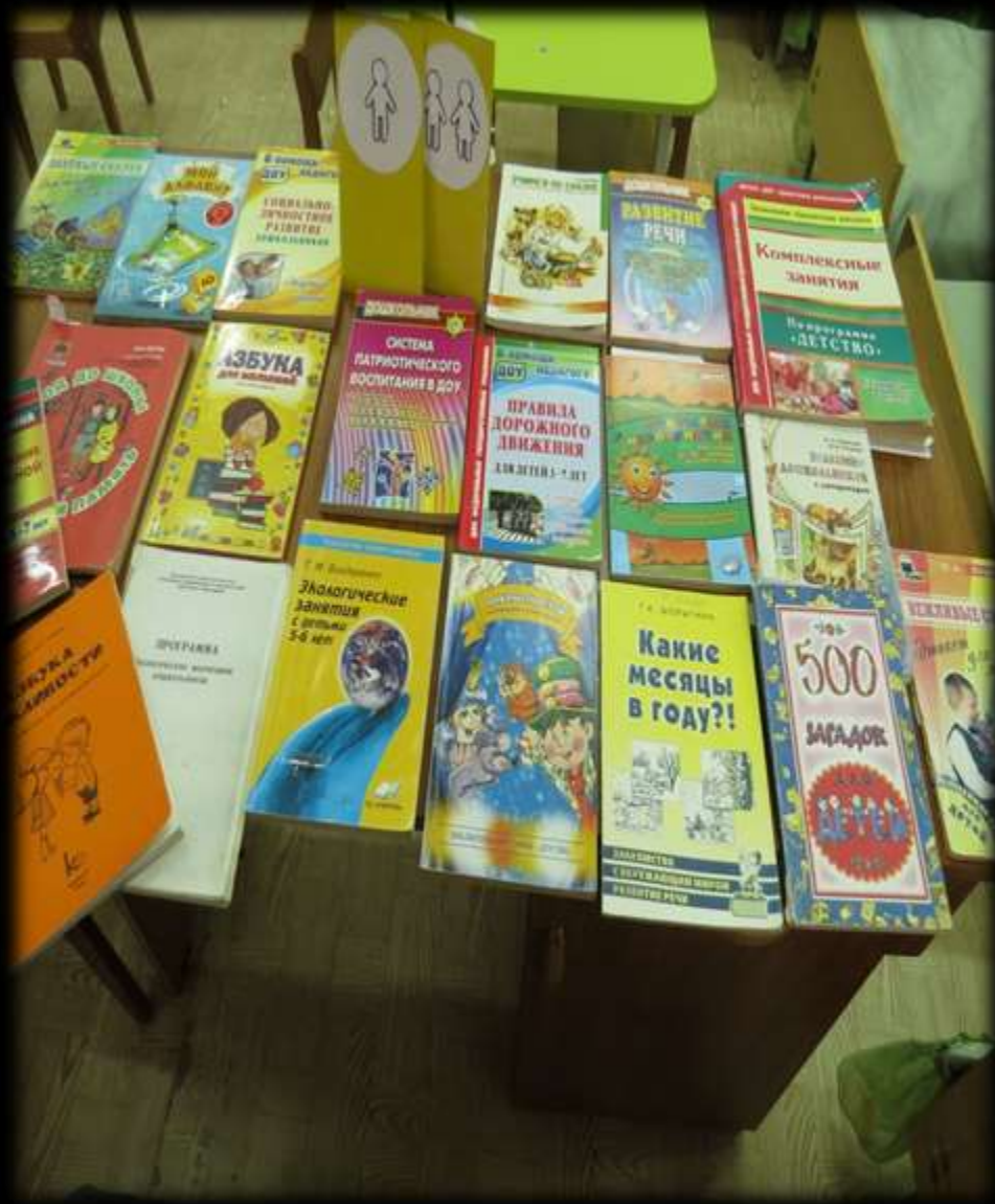
(методическая литература педагога)