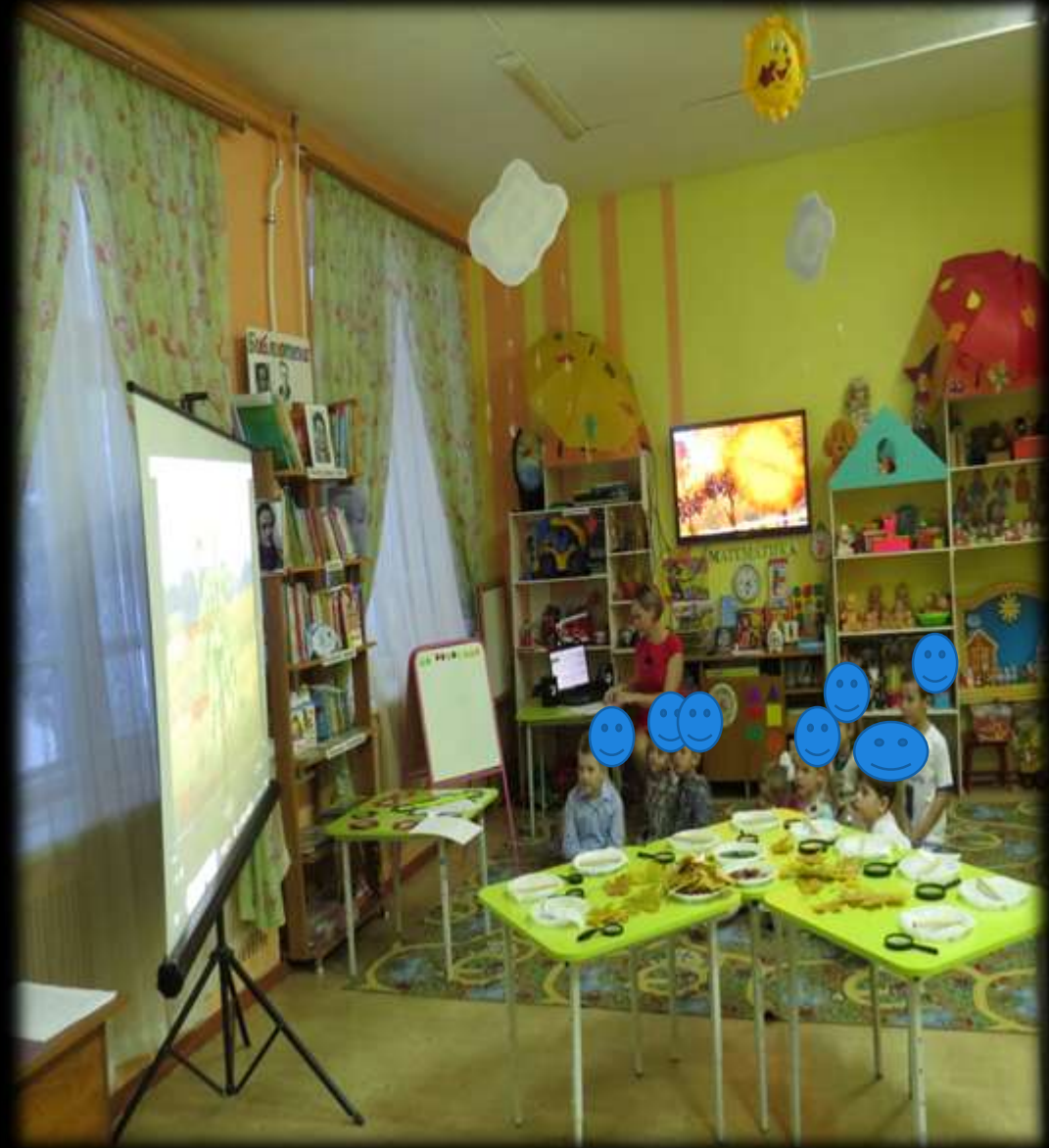
(ИКТ для педагога)