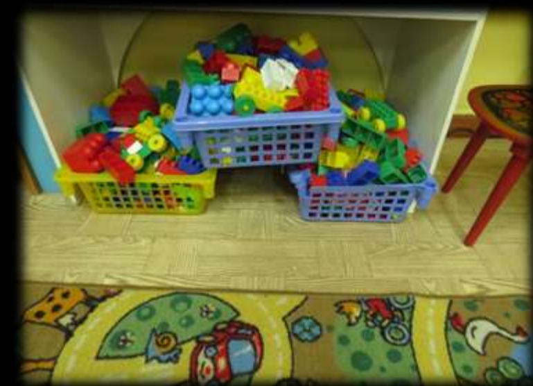
Математика и конструирование